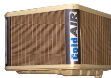
TA 209H TC 209H