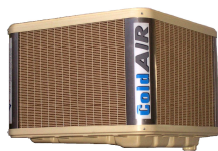
TA 159H TC 109H