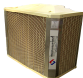
FPA 109H FPA 159H

Adiabatický chladicí systém COLDAIR představuje nejmodernější technologii chlazení a větrání velkých prostor jako jsou průmysly, řemeslná výroba, sklady a úložny, obchodní prostory, sportovní centra, výstavní pavilony, veřejné haly, hospůdky a rychlé občerstvení, tělocvičny a mnoho dalších prostor, kde tradiční klimatizační systém by znamenal vysoké náklady na instalaci a velkou spotřebu energie.